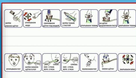
АЛГОРИТМЫ ФОРМИРОВАНИЯ НАВЫКОВ ПОВСЕДНЕВНОЙ АКТИВНОСТИ