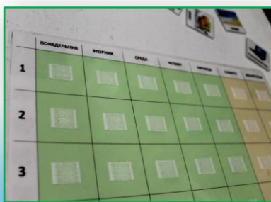
РАСПИСАНИЕ НА НЕДЕЛЮ