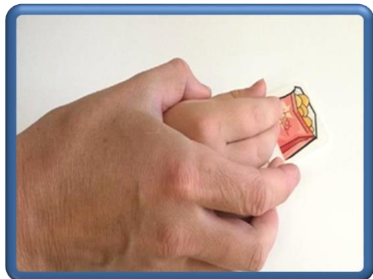
Способ «рука в руке»