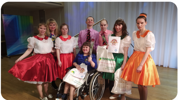
танцевальный коллектив «Стиляги»

Регулярные занятия способствуют развитию и закреплению у получателей социальных услуг таких ценных качеств личности, как усидчивость, целеустремленность, умение доводить начатое дело до конца.