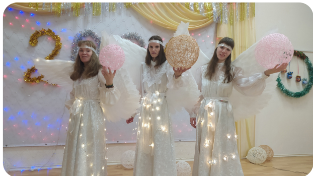
танцевальный коллектив «Ангелы Kleo»

Поиск путей самовыражения воплотился в создание танцевальных коллективов. Это формирование собственного стиля, постановка танцевальных номеров, изготовление креативных костюмов.